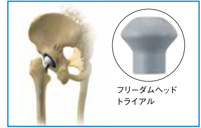
フリーダムヘッド トライアル

適切なフリーダムライナートライアルを、3.5mm ヘックススクロッドライバーでシェルに固定します。